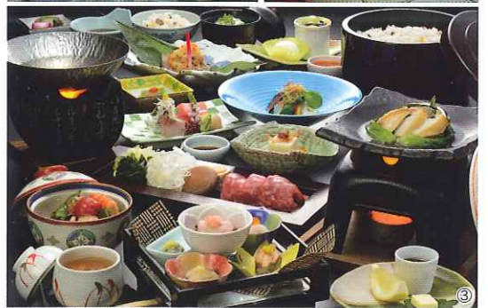
①花巻南温泉郷で最大級の「とよさわ乃湯」露天風呂。②天井の各天井や襖の細工など、宮大工が丹念に仕上げた上質な和室でのんびり過ごせる。③山・里・海の幸が皿を彩り、五感を楽しませる。