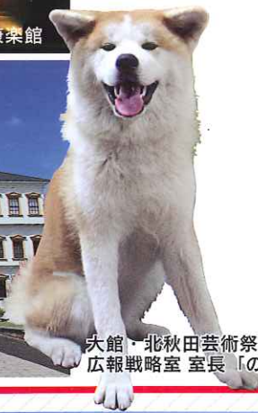
大館・北秋田芸術祭 2014 広報戦略室 室長「ののちゃん」