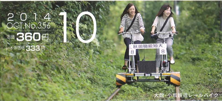
大館・小坂鉄道レールハイク