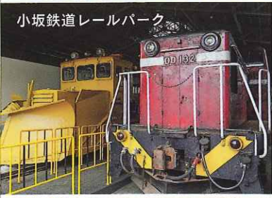
小坂鉄道レールパーク