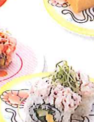
人気No.1「絶品かつぱのオリジナルサラダロール」(108円)

「人気のアツアツサイドメニュー」 新ネタ、新シャリ、新メニューで、おしい進化がとまらない「かつぱ寿司」にぎりや軍艦、巻物など定番人気のお寿司をはじめ、ひと手間加えた創作寿司も人気です。 また、サイドメニューもリニューアル。これからの季節にうれしい、アツアツ・ホカホカメニューも豊富にラインナップしています。 新登場の「塩ラーメン」(288円) ※販売店舗限定は、チャーシュー、メンマ、わかめ、フラー