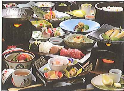
料理長がこだわり抜いた、自慢の料理が並びます(写真はイメージです)

お部屋食のんびりプランは、お部屋で源泉掛け流し。まるで美容液のようにとろりとした