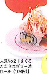
人気No.2「まぐろたたきむぎろー油ロール」(108円)