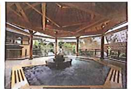
2つの大浴場と2つの露天風呂、貸切露天風呂を備えた、源泉掛け流しの「南台ゆり家の湯」。貸切露天風呂は45分1500円(要予約)

華友膳プラン ●利用期間/10月31日(金)まで ※宿泊前日の15時までに、電話またはホームページから要予約 ※ホームページから予約した場合は、夕食時にビールまたはソフトドリンクを1人に1本サービス ●料金(1泊2食付き)/2人1室利用 1人1万8000円〜 ※子ども料金あり