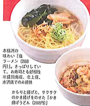
本格派の味わい「塩ラーメン」(288円)。もっちりしていて、お寿司とも好相性。盛岡南店、北上店、水沢店でのみ提供