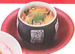
濃厚な味わいととろける食感。「かつぱの特製ふかひれあんかけ茶碗蒸し」(194円)