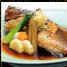
ソイの煮付け 北国の魚・ソイを醤油ベースの 出汁で煮付けた逸品。