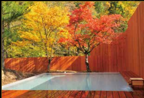
こもれば乃湯 露天風呂

「とよさわ乃湯」の大露天風呂は花巻南温泉郷随一を誇る広さを持ち、「こもれば乃湯」の内風呂はガーデンテラスのような雰囲気。酒々と流れる湯は、pH値が9.2もあるアルカリ性単純温泉。湯上がりはしっとり滑らかな美肌の湯をご堪能ください。