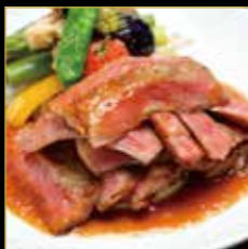
前沢牛サーロイン 全国に誇る前沢牛のステーキ。 肉の旨味をご堪能ください。