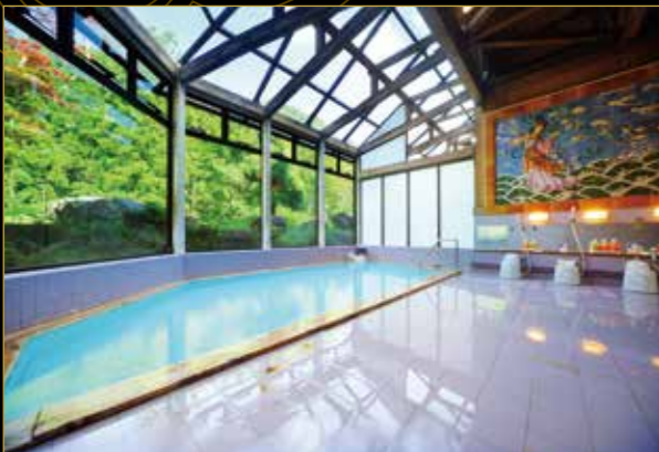
こもれば乃湯 内風呂 (サウナ完備)

豊沢川のせせらぎ、鳥の声を聴きながら入る大露天風呂。 天井が高く、中国の陶板画があり、湯屋の風情が漂う内風呂。 それぞれ異なる魅力がある風呂の湯は、もちろん源泉かけ 流し。豊富な湧出量を誇り、とろみのある湯は、昔から 地元の人々に愛され、大切に守られてきました。