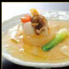
ふかひれのやわらか煮 コラーゲンたっぷりのふかひれを 使用。美容と健康の一皿。