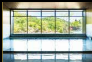
優香苑同様、とろみのあるお湯を源泉かけ流し