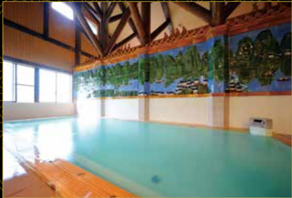
とよさわ乃湯 内風呂