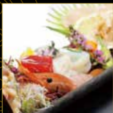
刺身の盛り合わせ 国内産をメインにした海の幸。 地酒と共にどうぞ。