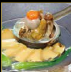
あわびの柔らかか煮