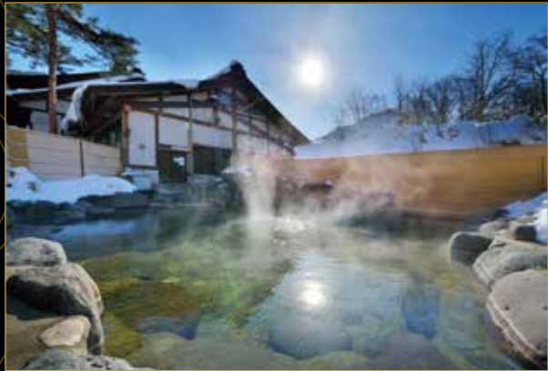
とよさわ乃湯 大露天風呂